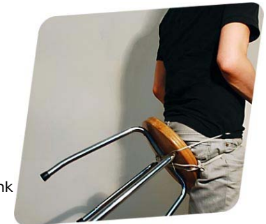
Das Corporate Design-Gesamtkonzept des Sitzbank Designwettbewerbs kam von juicy pool

Aufgaben: allgemeine PR / Schwerpunkt Fachöffentlichkeit Architektur Designwettbewerbe Zeitraum: seit 2007 www.wiesner-hager.com