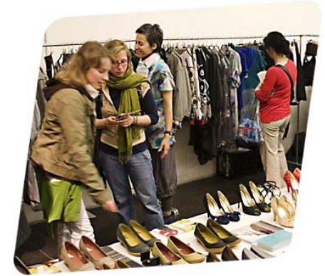
Der Modepalast

Aufgaben: nationale & internationale PR Zeitraum: seit 2006 www.modepalast.com