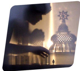
Passionswege-Installation von Maxim Velcovsky bei Lobmeyr, VIENNA DESIGN WEEK 2008

Unter dem Label der VIENNA DESIGN WEEK versammeln sich eine Vielzahl hochkarätiger Institutionen und Protagonisten aus dem Bereich Produktdesign sowie PartnerInnen aus der Wirtschaft. Es vernetzen sich Design-Schaffende mit Design-ProduzentInnen. Die jährlich wiederkehrende VIENNA DESIGN WEEK schärft die Wahrnehmung für Design, zeigt unterschiedliche Ansätze und will vor allem Lust auf Design machen.