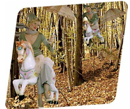
Mode von modus vivendi

Aufgaben: Workshops / Consulting / allgemeine PR Zeitraum: seit August 2005 www.modusvivendi.at